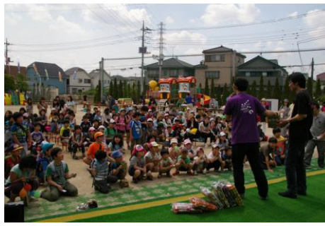
みんな参加してくれて有難う