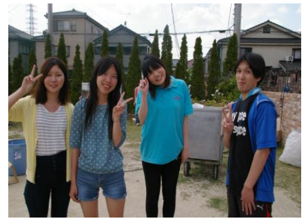
今日は楽しかったね