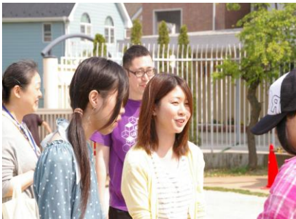
さあ、準備をしなくっちゃ！