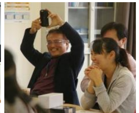
このイベント楽しいー