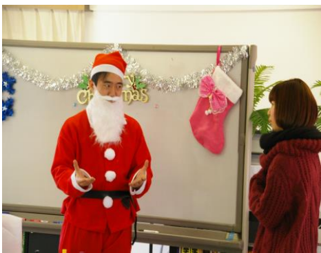
あ、っ、サンタさんだ！