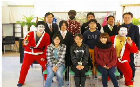
みんなで記念写真