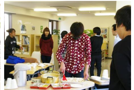
みんなでチラン寿司作り