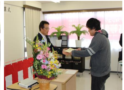
今日まで良くがんばったね