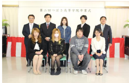
みんな本当におめでとう