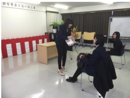
今、夢中になっていることは？