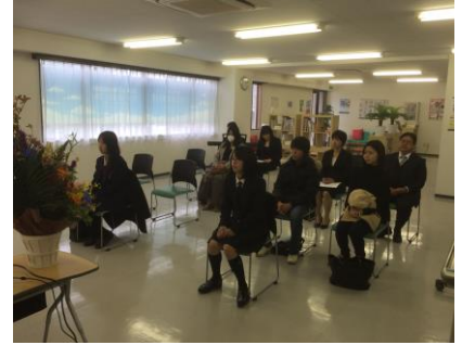
今日からがんばっていきましょう