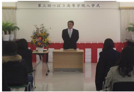
みんな本当におめでとう