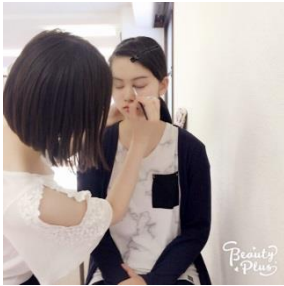
夢の種プロジェクト