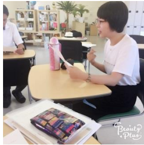
宝塚観劇事前講習